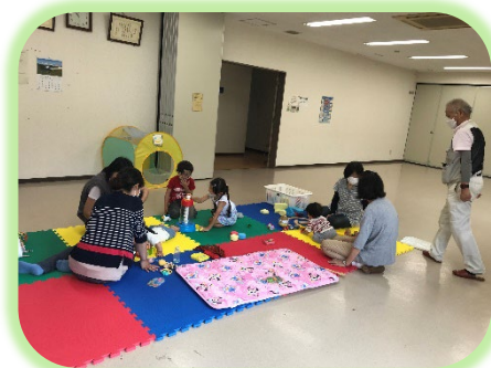
子育てサロン (グリーンキッズ)