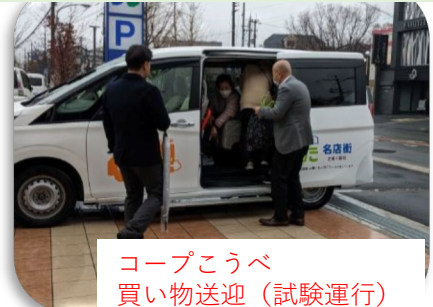
コープこうべ 買い物送迎 (試験運行)