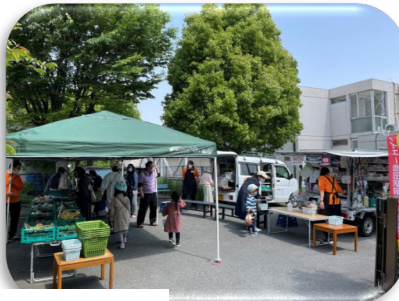
ダイエー移動販売