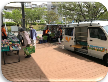
池田市のダイエー 移動販売がテレビ で放送されました

日常の買い物が困難になっているニーズに地域の皆さんと話し合い、ダイエーの移動販売が開始されました。月から土の週6回市内各所や高齢者施設などで行い、買い物に出かけることが困難な方々に大変喜んでいただいています。買い物を通じて地域の中で「顔のつながる関係づくり」ができています。コロナ感染症も5類に引き下げられましたので、地域コミュニティの場として移動販売を充実していきたいと思います。