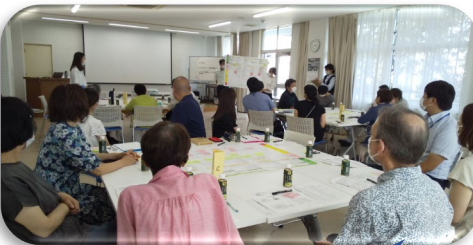
地区懇談会 (池田市地域福祉計画策定)