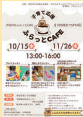
2年連続2回開催 メンバー作のチラシ

メンバーのつながりから、保育士によるプレイコーナー、市保育コンシェルジュ相談コーナー、助産師会の防災対策コーナーなど、多彩なブースをつくることができました。