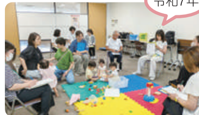
▲ 居場所プロジェクト会議の様子 当事者や他団体の参加も増えています