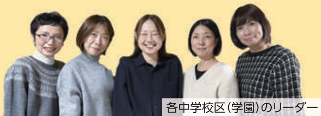
各中学校区(学園)のリーダー

プラットフォームでの出会いをきっかけに、不登校に関わる支援者と親がつながる場「道しるべサロン」が令和7年5月に誕生しました。