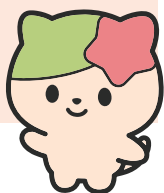
池田市社協 キャラクター さっち

五月山と市の花「さつきつつじ」が模様になったねこ。 人に寄り添ってぬくもるのが好き。