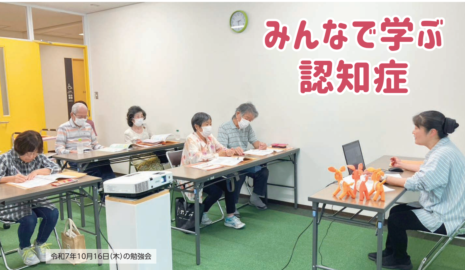
令和7年10月16日(木)の勉強会

社会福祉協議会(社協)は、住民が主体となり、誰もが安心して暮らせる福祉のまちづくりに取り組む、民間の団体です。