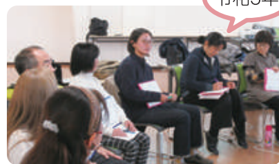
▲ 初年度は、2回にわたり、課題を共有18団体のべ35人が参加しました