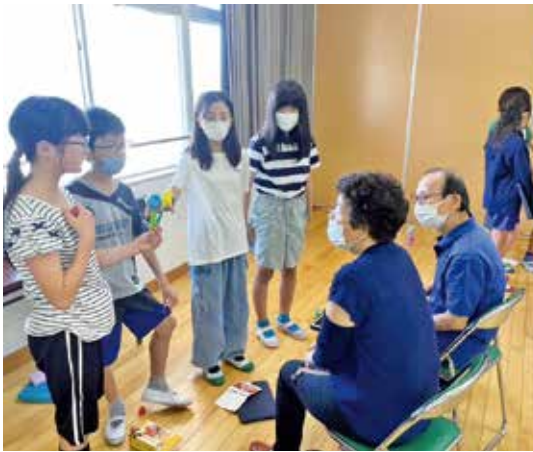
▲子どもたちの出し物に興味津々の「ふれあいサロン」

その結果、地域の高齢者を学校へ招くイベントをすることになり、福祉委員も協力しました。