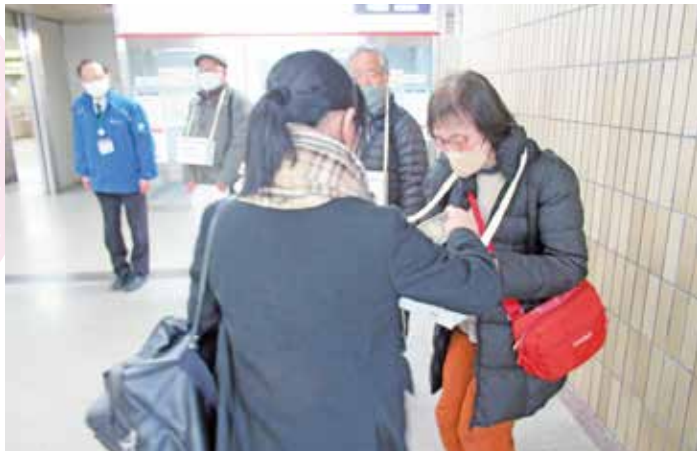
▲市民のみなさんからの善意が復興の後押しになります

ボランティア活動が難しい方は、その活動を金銭的に支援する方法があります。ご自身の希望にあった活動をしている団体に、寄付や募金などをするのはいかがでしょうか。