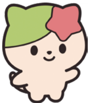
池田市社協キャラクター さっち

春は、新しいことが始まる季節。思いついて、ボランティア活動を始めてみませんか。 「でも、ボランティア活動はしたいけど、時間がない」「ボランティア活動は資格や技術が必要なのでは？」と思っ ていませんか。 もちろん、それらが必要なものもありますが、気軽に始められるものもあります。今回は、いろいろなボランティア活動の中から、その一部をご紹介します。