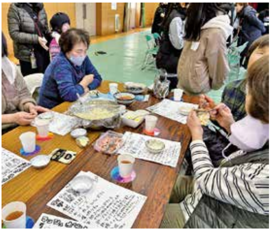
▲マッシュポテトに参加者も大満足

体育館には、全部で12のブースが設けられました。その中で目についたのが、7分クッキングのマッシュポテトコーナー。これを主催した子どもは「インタビューでお年寄りの方が、『レシピを忘れてしまつて料理が大変だ』と言っていました。簡単でやわらかい食べ物レシピを知ってほしいと思い、このコーナーを作りました」と話していました。