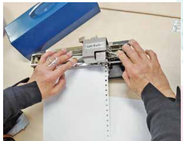
▲慣れ親しんだ点字タイプライターは手になじみます