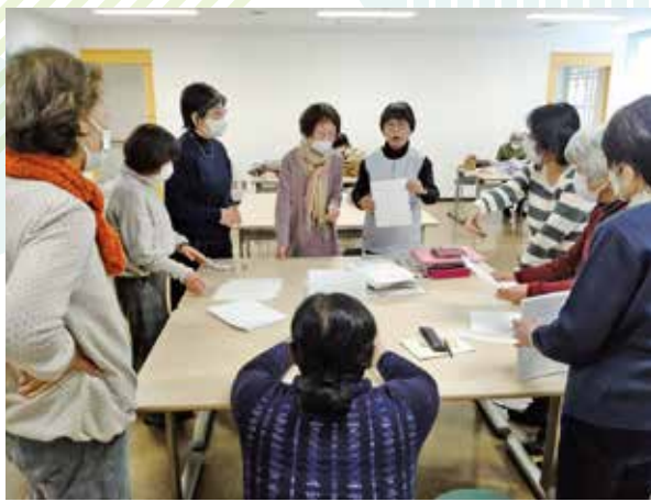
▲メンバーで点訳作業について打ち合わせをします