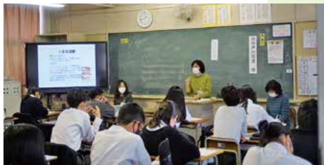
▲学校からの依頼でボランティアの方たちが出前授業を行います（中学生向け福祉授業）