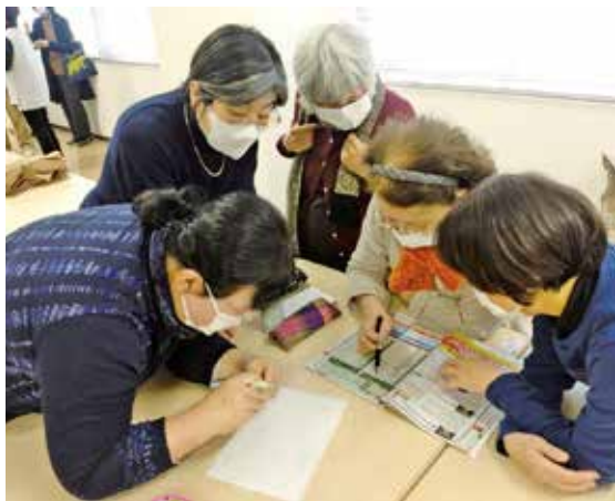
▲原本を見ながら、点字の打ち方の確認をします