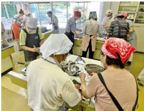
▲男性の方の集いの場になっています（地区福祉委員会主催 男性料理教室）

今年度も各地区福祉委員会のみなさんが募集を行いますので、ご協力よろしくお願いいたします。