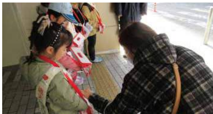
▲ボーイスカウト池田第1団による街頭募金(12月8日阪急池田駅)

赤い羽根共同募金は、大阪府下の福祉施設や福祉団体など に配分され、地域福祉の充実のために役立てられます。