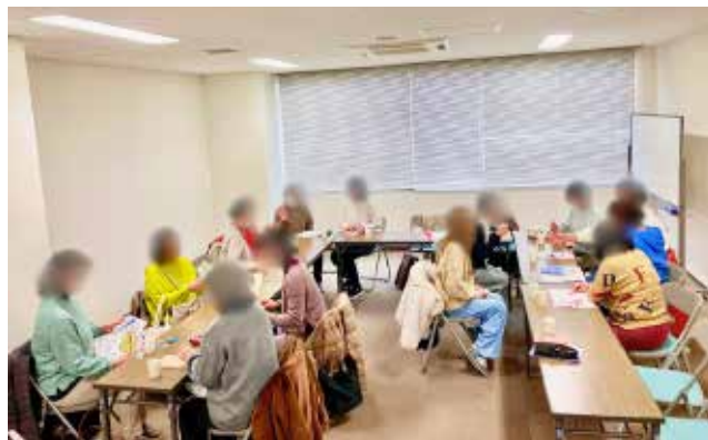
▲第1回12/13(金)のつどい。14人が参加しました。

日時 2月14日(金)13時30分~15時30分 場所 保健福祉総合センター 4階 講習会室 参加費 無料 問合せ 地域福祉課 コミュニティソーシャルワーカー Tel: 751-0421