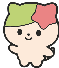
池田市社協キャラクター さっち