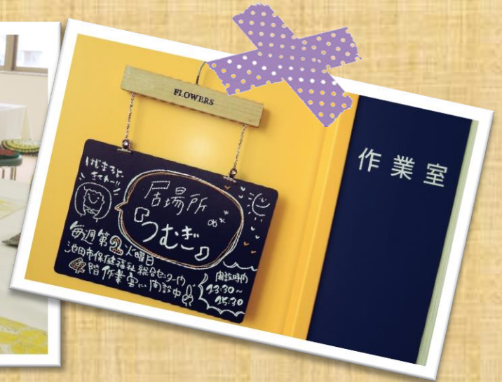
↑ つむぎの中の様子